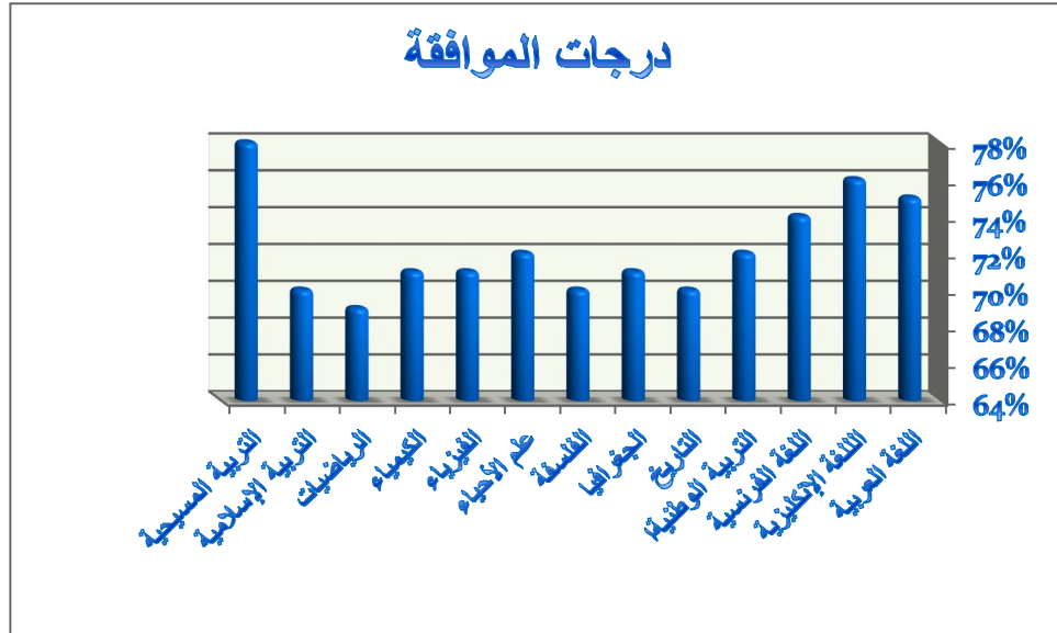
الشكل البياني رقم (٢)

درجات الموافقة لآراء المدرسين على بنود الاستبيان ككل